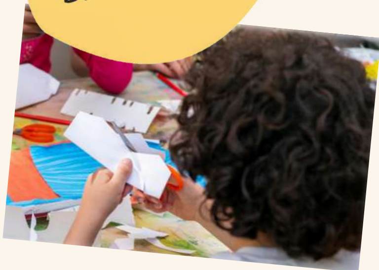
TABLE FANTOME Eveil artistique